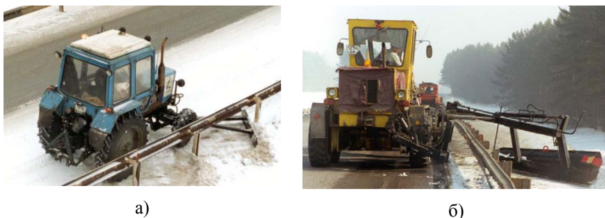
Рис. 2. – Уборка снега на автомобильной дороге с дорожным ограждением: а) под дорожным ограждением; б) за дорожным ограждением

На рис. 2 представлена уборка снега на автомобильной дороге с дорожным ограждением, в которой с начала под дорожным ограждением (рис. 2, а) проходит трактор с отвалом (МТЗ), а после него за дорожным ограждением (рис. 2, б) уборку снега осуществляет автогрейдер с боковым отвалом (ОБГ- 2).