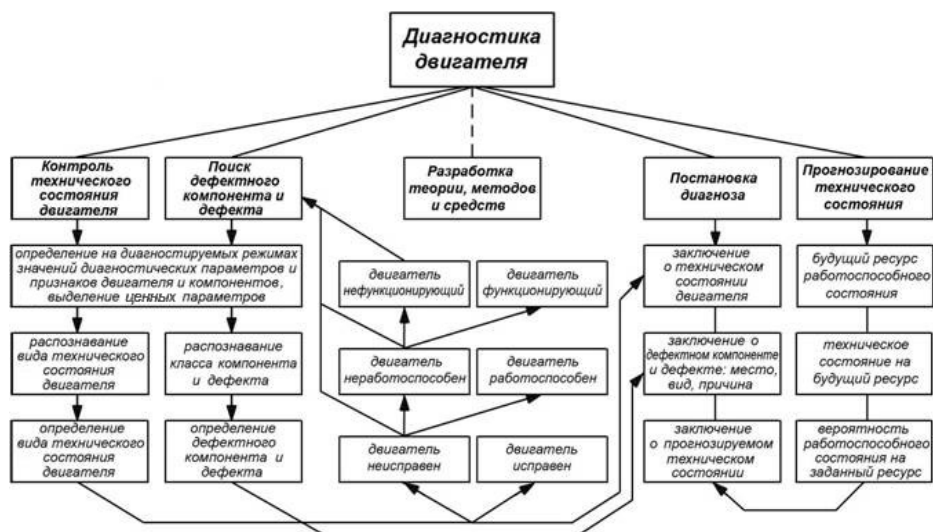
Рис.2 – Принцип действия дистанционной диагностики двигателя

Передача сигналов, поступающих от контроллеров управления, и сигналов, входящих в комплекс, происходит с первичными формой и протоколом, подходящими для обработки стандартными диагностическими устройствами. Сигнал, который передается в обоих направлениях по телекоммуникационными средствами (телекоммуникационным средствам связи) связи осуществляют со вторичными формой и протоколом, пригодными для передачи коммутационными средствами связи [9,10]. Переход от первичных формы и протокола ко вторичным и обратно производят путем процессорного преобразования. Данный метод преобразования повышает качество дистанционной диагностике (диагностики) автомобиля, который очень важен для автомобилистов, двигающихся по трассе и (которым?) из-за внезапной поломки пришлось остановиться в дали (вдали) от ближайшего пункта технической помощи.