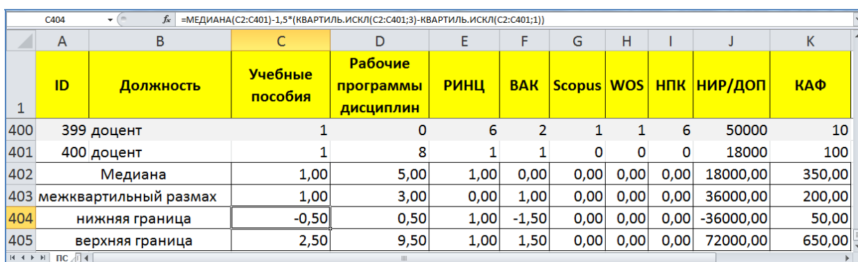
Рис. 2. – Расчет норм должностных показателей качества

При этом если в целом по организации какой-то из показателей имел за отчетный период очень низкие значения, например, было выпущено мало учебно-методической литературы, то это приведет к тому, что нижняя граница нормы станет отрицательной (рис. 2) и, полное отсутствие у сотрудника указанных пособий, не приведет к невыполнению рассматриваемого показателя. Но и причин для премирования такого работника не будет.